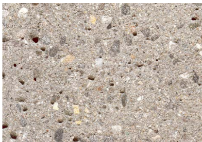
Beton grau Sandgestrahlt / Kies 0-16 mm