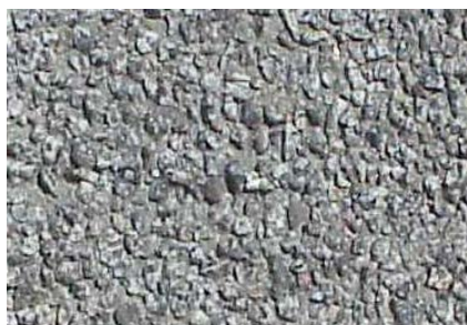
Vorsatz Granit Gewaschen