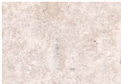
Beton grau Schalungsglatt