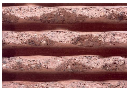
Beton eingefärbt 4 % Braun Rudolfstruktur Kanten gebrochen