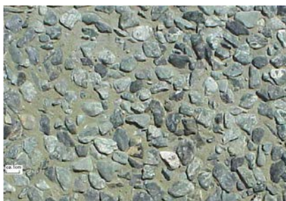
Vorsatz Verde Alpi Grün Gewaschen