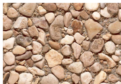
Vorsatz Delsberger Gewaschen Kies 0-4 / 8-16 mm