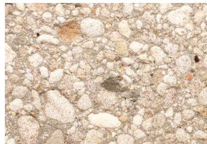
Vorsatz Delsberger Sandgestrahlt / Kies 0-30 mm