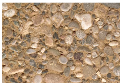
Beton eingefärbt 4 % Gelb Gebürstet / Kies 0-30 mm