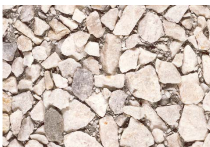
Vorsatz Quarzit Gewaschen / Kies 0-15 mm