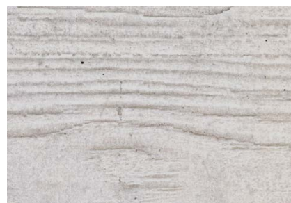
Beton grau Brettstruktur